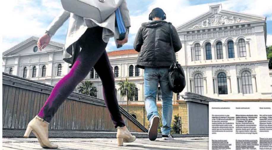
La alerta se disparó hace quince días y están en marcha controles para ver la evolución de los estudiantes cercanos al afectado. A la derecha, nota del Decanato instando a acudir a la revisión.

La alerta se disparó hace quince días, cuando se descubrió lo que en epidemiología se conoce como el 'caso índice', el primero de un brote. El viernes pasado, los estudiantes que compartían clases con la joven -sobre todo de primero y segundo curso- fueron